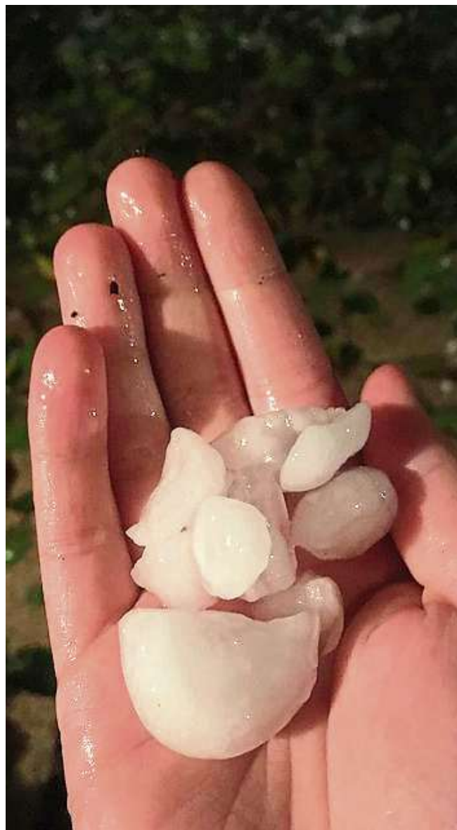
Bis zu vier Zentimeter gross. Hagelkörner in Basel (links) und in Riehen (rechts). Leserfotos

Wie die Basler Polizei auf Nachfrage mitteilt, gab es in der Stadt aufgrund des Gewitters keine Notrufe.